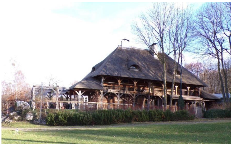
Fot. 11. Spichlerz z Borowna w Olsztynie.

Do budynków gospodarczych, ze względu na pierwotną funkcję, zaliczyć należy spichlerz z Borowna w gm. Mykanów, przeniesiony do Olsztyna w 2007 r. i zaadaptowany na restaurację. Znajduje się on na północ od ruin zamku Olsztyn przy DK46. Jest to spichlerz galeriowy, nie pochodzący bezpośrednio z obszaru gminy, aczkolwiek stanowiący unikatowy przykład wiejskiej architektury drewnianej. Wzniesiony w 1783 r. w Borownie, wchodzący w skład zagrody dworskiej, w sąsiedztwie innych budynków gospodarczych. Jest to budynek na planie prostokąta, w konstrukcji zrębowej. Spichlerz jest dwukondygnacyjny z dwupoziomowymi galeriami arkadowymi wzdłuż ścian dłuższych i z użytkowym poddaszem, wtórną kondygnacją piwnicy z cegły. Przed rekonstrukcją kryty dachówką cementową, obecnie strzechą.