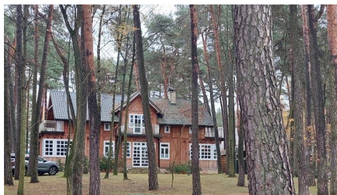
Fot. 13. Willa przy ul. Napoleona 31 oraz drewniana willa przy ul. Kühna 37 w Olsztynie.