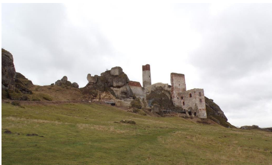
Fot. 5. Ruiny zamku w Olsztynie.

Przykładami budownictwa obronnego w gminie Olsztyn jest zamek Olsztyn i Wieża Sołtysia. Oba obiekty zostały wybudowane na terenie rozległego wzniesienia wapiennego zwanego Górą Zamkową. Zamek Olsztyn powstał w 2 poł. XIII w. prawdopodobnie z fundacji biskupów krakowskich. Po raz pierwszy wzmiankowany jest w latach 1306-1308. W latach 40-tych XIV w. został przebudowany przez króla Kazimierza Wielkiego. W XV i XVI w. był remontowany i rozbudowywany. Pod koniec XVI w. zamek częściowo zniszczono podczas oblężenia przez wojska Maksymiliana Habsburga, broniony przez burgrabiego Kacpra Karlińskiego. Wojny szwedzkie z lat 1655-1656 i 1702 pogłębiły ruinę zamku. Przed 1729 r. został częściowo rozebrany w celu pozyskania kamienia na budowę nowego kościoła w Olsztynie.