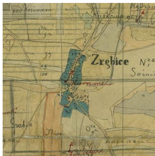
Fot. 4. Mapy z roku 1825, przedstawiające wsie Biskupice i Zrębice.

Gmina Olsztyn miała charakter rolniczy. Nadal w głównej mierze taką pozostała. Miało to - i nadal ma - znaczący wpływ na kształt tutejszego krajobrazu kulturowego. Osadnictwo na terenach wiejskich do połowy XIX w. było rozproszone, co prezentują mapy topograficzne Dóbr Ekonomii Olsztyńskiej z 1 poł. XIX w. (1830 i lata 40. XIX w.).