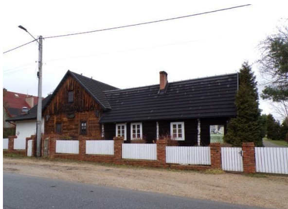
Fot. 10. Chałupa, przy ul. Zrębskiej 93 w Biskupicach.