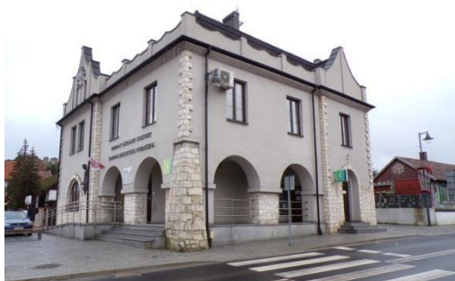
Fot. 8. Budynek Gminnego Ośrodka Kultury w Olsztynie.

Do powyższych obiektów na terenie gminy Olsztyn zaliczyć trzeba dawny budynek urzędu gminy (obecnie Gminny Ośrodek Kultury) oraz budynek plebanii przy kościele pw. św. Jana Chrzciciela w Olsztynie, a także budynek dworca kolejowego w Turowie.