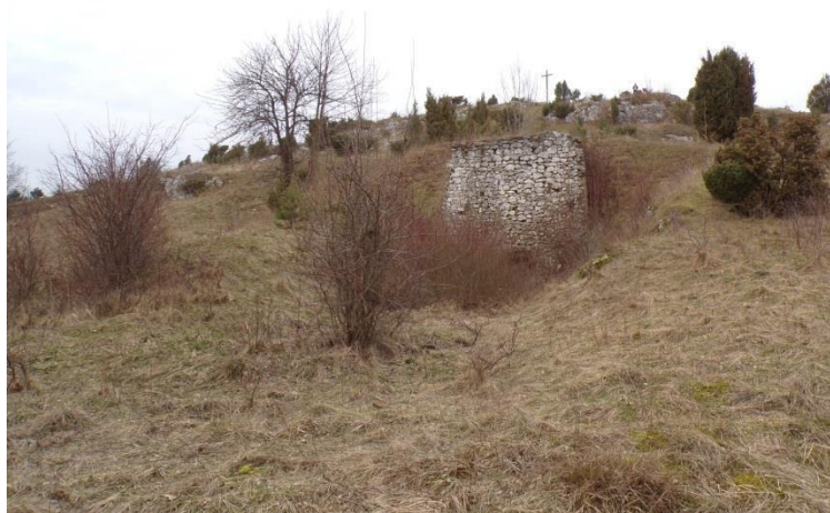
Fot. 12. Piec wapienniczy przy drodze z Olsztyna do Przymiłowic.

Drugi wapiennik zlokalizowany jest na wschód od Olsztyna, na północ od drogi krajowej DK 46 (ul. Kazimierza Wielkiego) w kierunku Przymiłowic. Ogólnie datowany jest na koniec XIX-XX w. Był to piec wapienniczy wbudowany w południowy stok wzgórza wapiennego Góra Skałki Duże, które zostało najprawdopodobniej odpowiednio ukształtowane. Budowla na planie czworokąta o szer. 6 m u podstawy i wysokości około 5,5 m, ze stroną licową od południa. Wymurowany z łamanego kamienia wapiennego z niewielkim udziałem cegły.