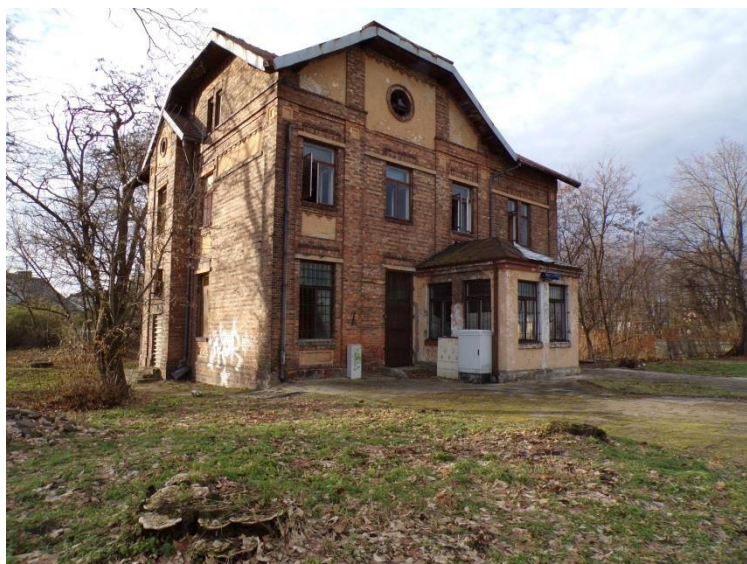
Fot. 9. Budynek dworca kolejowego w Turowie.