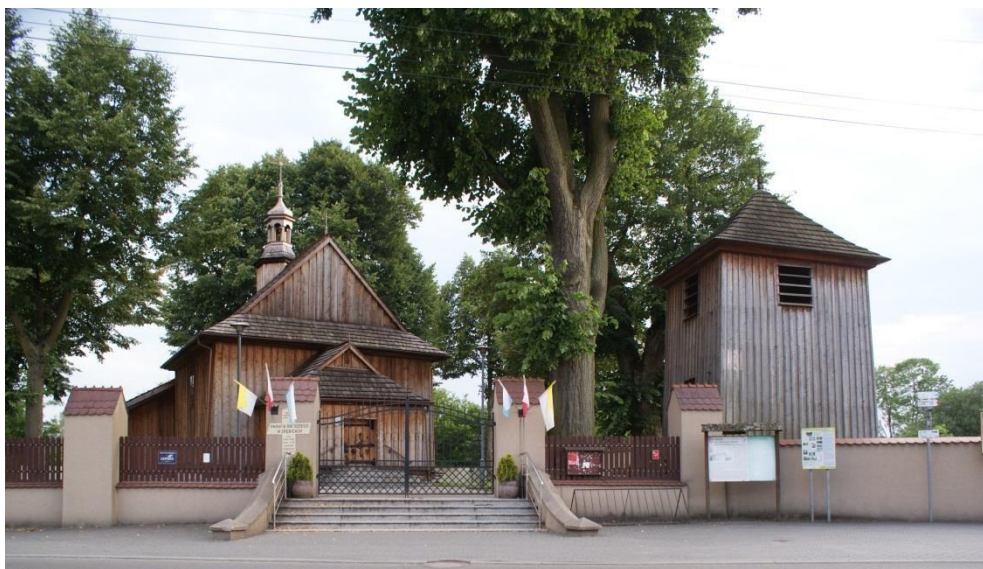
Fot. 7. Drewniany kościół pw. św. Idziego wraz z dzwonnicyą w Zrębicach.

Nad nawą została umieszczona sześcioboczna sygnaturka, z hełmem cebulastym krytym blachą. Wnętrze utrzymane w stylu barokowym z XVII-wiecznym ołtarzem głównym, przerobionym w XVIII w., przeniesionym ze starszego kościoła. Na uwagę zasługuje XVIII-wieczna ambona, późnogotycka kamienna chrzcielnica, obraz św. Idziego z 1714 r.