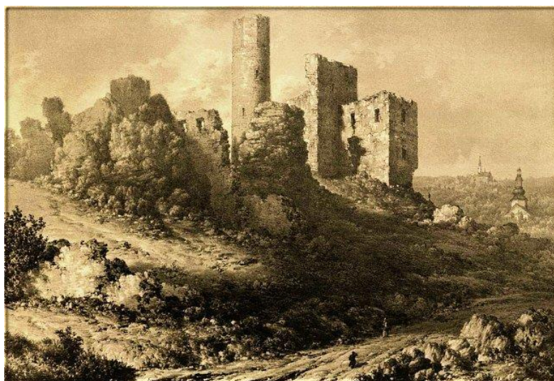
Fot. 3. Zamek na litografii N. Ordy, Album Widoków z roku 1871.

W 1818 r. władze rosyjskie zlikwidowały starostwo olsztyńskie. Z części jego ziem utworzyły Ekonomię Dóbr Olsztyńskich, a część przyłączyły do Ekonomii Dóbr Poczemiańskich. Olsztyn w tym czasie znalazł się w obwodzie olkuskim w województwie krakowskim, a następnie w powiecie olkuskim w guberni radomskiej. W Olsztynie pozostała szkoła z językiem polskim i gmina miejska z burmistrzem na czele. W 1827 r. miasto liczyło 100 domów i 506 mieszkańców. W pierwszej połowie XIX w. otwarto nowy cmentarz przy ul. Kościelnej, który pozostaje w gestii parafii katolickiej.