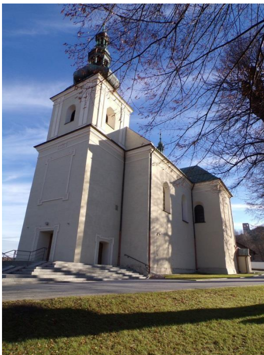
Fot. 6. Kościół pw. św. Jana Chrzciciela w Olsztynie.

Najstarszą budowlą sakralną na terenie gminy Olsztyn jest kościół parafialny pw. św. Jana Chrzciciela, usytuowany w północno-wschodniej części Olsztyna, u podnóża wzgórza zamkowego, w pobliżu rozwidlenia dróg w kierunku na Janów i Turów. Jest to kościół murowany z kamienia wapiennego pochodzącego z murów zamku i cegły na zaprawie wapiennej, wzniesiony w latach 1722-1729, staraniem proboszcza Albina Łączyńskiego, Jerzego Lubomirskiego starosty olsztyńskiego i kazimierskiego oraz Wojciecha z Kurozwek Męcińskiego, starosty ostrzeszowskiego.